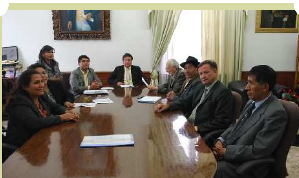
Sala Plena en reunión

Para lograr un cambio en la justicia es importante contar con códigos procesales y sustantivos nuevos, tarea reservada al Órgano Legislativo, que ha comprometido sancionar hasta el 6 de agosto del presente año dos códigos procesales más, el penal y el social.