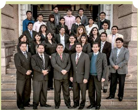
Unidad de Enlace Administrativo y Financiero

Es la unidad operativa que dentro de su competencia asume los asuntos administrativos y financieros del Tribunal Supremo de Justicia, para contribuir con el normal progreso de las actividades jurisdiccionales y alcanzar los objetivos institucionales planteados en el marco de la Ley N° 025 del Órgano Judicial.