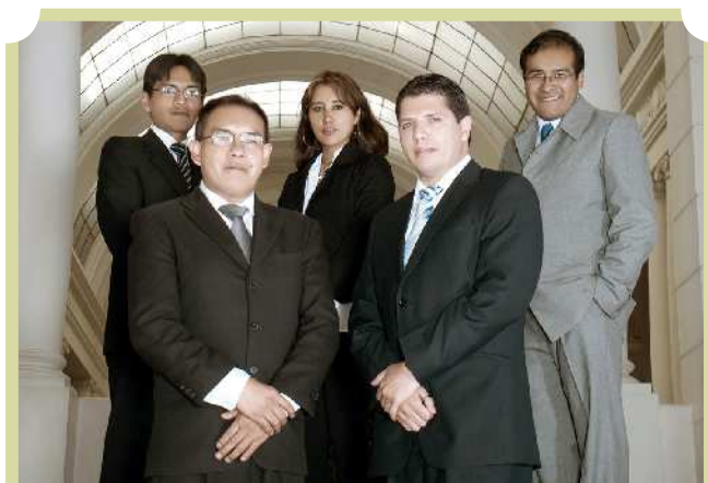
Unidad de Jurisprudencia

Asimismo, la Unidad ha ido realizando diferentes tareas que se detallan a continuación, pudiendo evidenciarse que la gestión fue positiva para la consolidación de un Tribunal que cuente con herramientas tecnológicas e informáticas que le permitan avanzar con paso firme en la consolidación del nuevo sistema de Justicia Plural.