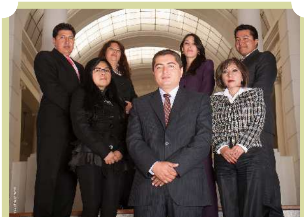
Unidad de Gestión de Servicios Judiciales

La Unidad de Gestión de Servicios Judiciales fue establecida dentro de la estructura del Tribunal Supremo de Justicia en observancia a la nueva composición del Órgano Judicial, de acuerdo a lo previsto por la Constitución Política del Estado, la Ley N° 025 del Órgano Judicial y la Ley N° 212 de Transición, de 23 de diciembre de 2011.