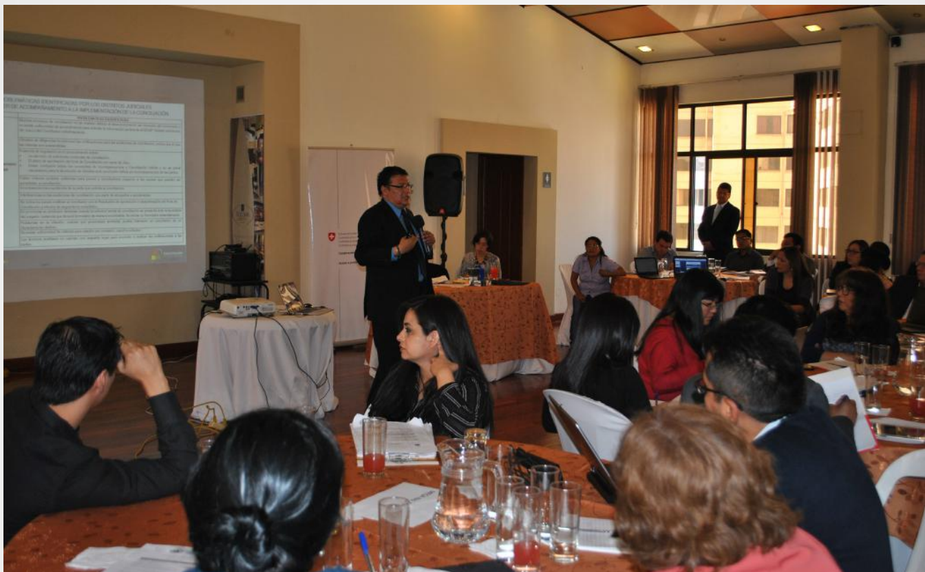
Segunda reunión de evaluación de la implementación de la conciliación en sede judicial a cargo del Comité Técnico de Seguimiento, septiembre de 2016 en Cochabamba