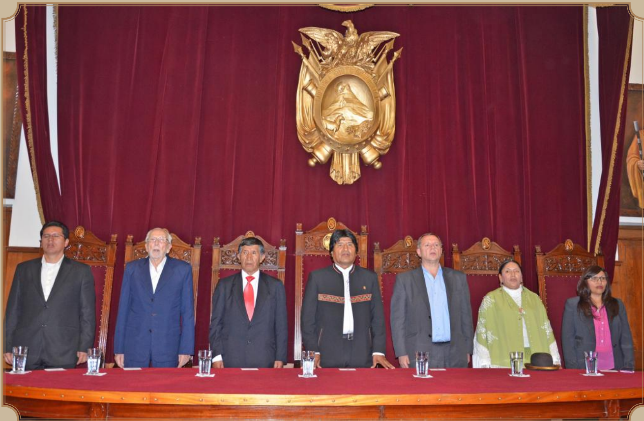
Autoridades de los Órganos Ejecutivo, Judicial y Legislativo durante el acto oficial de puesta en vigencia del Código Procesal Civil y Código de las Familias y Proceso Familiar, realizó el 10 de febrero del 2016.