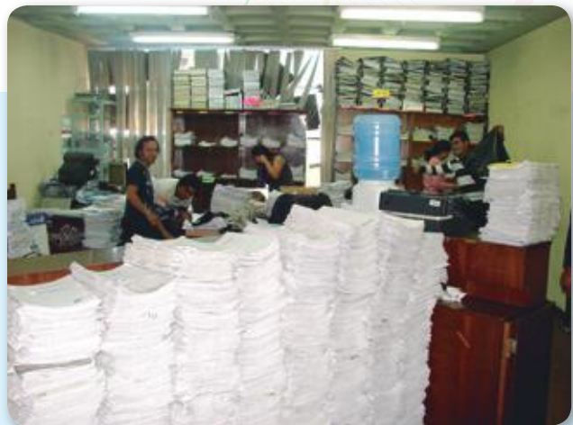
• Trabajo en fin de semana en un juzgado de Instrucción Penal en la ciudad de Cochabamba.

Se pronunciaron 130 sentencias en procedimiento abreviado, 346 resoluciones conclusivas en aplicación de salidas alternativas y 226 causas fueron remitidas a los Tribunales de Sentencia para el juicio oral una vez que fue celebrada la audiencia conclusiva; entretanto que 212 merecieron otro tipo de resolución definitiva (extinción, prescripción, etc.)