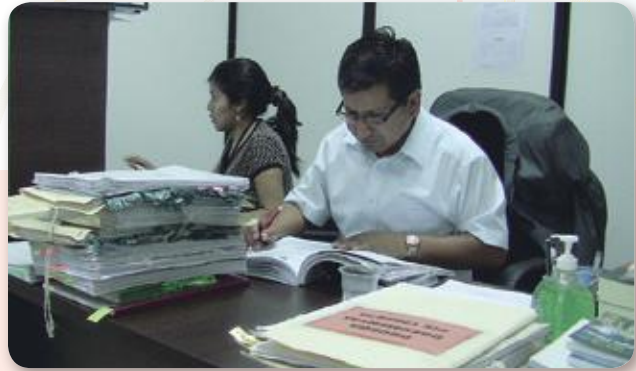
• Juez de Instrucción de Poroma, celebrando audiencia como juez Cautelar de la capital Sucre.

74 casos concluyeron por sentencia en procedimiento abreviado, 254 por aplicación de salida alternativa y 60 procesos, concluida la audiencia conclusiva, fueron remitidos a los Tribunales de Sentencia para la audiencia de juicio oral. Del total de causas priorizadas 82 corresponden a causas con detenido preventivo.