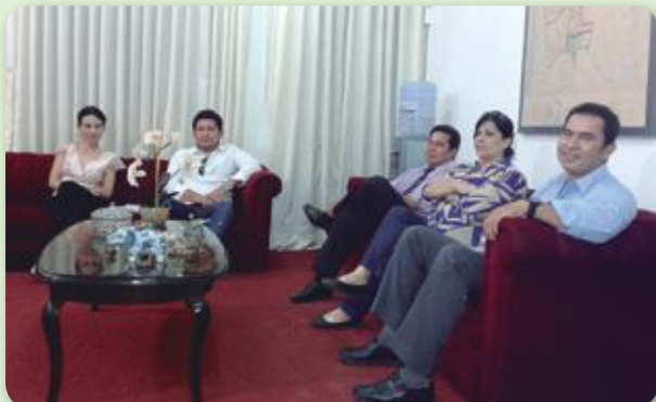
• Jueces Cautelares de Trinidad, Presidenta del Tribunal Departamental y Fiscal Departamental acuerdan celebrar audiencias conclusivas los fines de semana.

Se pronunciaron 46 sentencias en procedimiento abreviado, 110 resoluciones definitivas en aplicación de salidas alternativas y 7 causas fueron remitidas a juicio oral una vez celebrada la audiencia conclusiva.