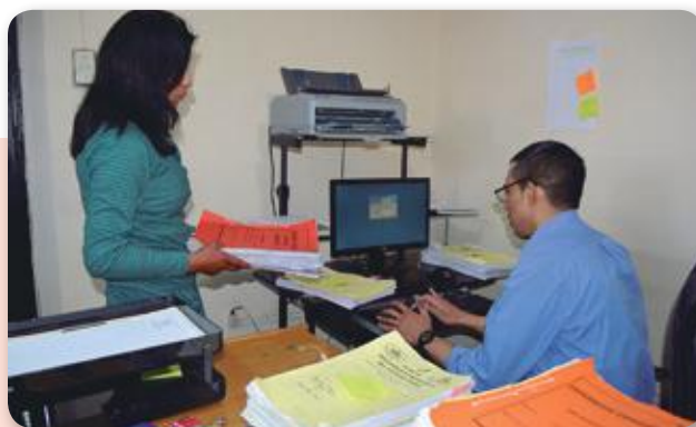
• Trabajo en un Juzgado Cautelar para la identificación de causas con detenido preventivo.

52 sentencias en procedimiento abreviado; 202 resoluciones definitivas por aplicación de salidas alternativas y 74 causas, celebrada la audiencia conclusiva fueron remitidas a Tribunales de Sentencia.