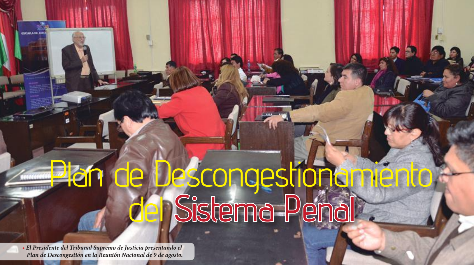
• El Presidente del Tribunal Supremo de Justicia presentando el Plan de Descongestión en la Reunión Nacional de 9 de agosto.