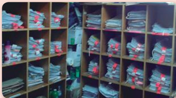
• Causas a la espera de audiencia en Juzgado Cautelar de Tarija.

84 causas remitidas a juicio oral una vez celebrada la audiencia conclusiva, 211 audiencias concluyeron por aplicación de salida alternativa y una en procedimiento abreviado.